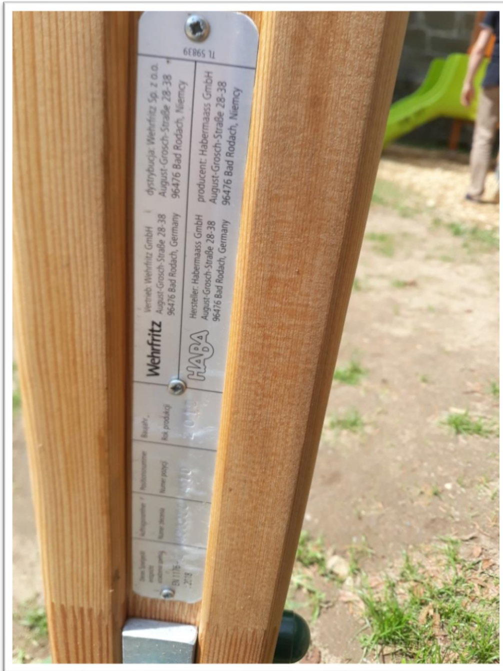
Kennzeichnung Funktions- und Sinneswände