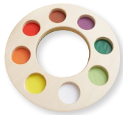
Wooden ring illustration